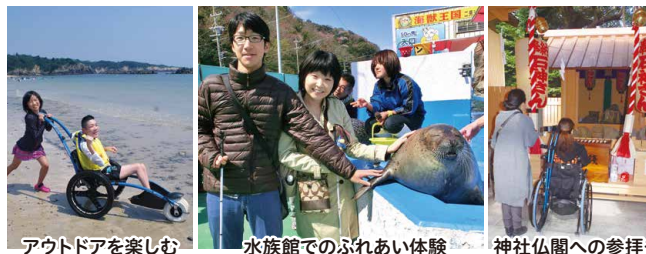
アウトドアを楽しむ 水族館でのふれあい体験 神社仏閣への参拝も

伊勢志摩バリアフリーツアーセンターは、 障がいや高齢のため外出に不安があるけれど