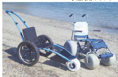
水陸両用の車いす

車いすを始め、ベビーカー・水陸両用の車いす・シャワーチェア・シャワーキャリー・JINRIKI(ジンリキ)などの貸し出しを行っています(一部有料)。また、電動ベッド(介護ベッド)などの福祉機器は、レンタル対応可能な事業所をご紹介します。